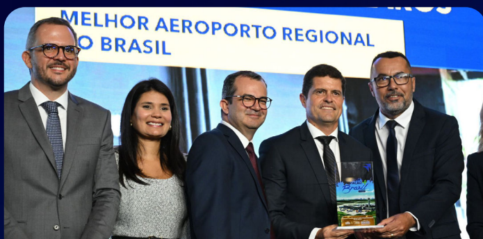
O Aeroporto de Montes Claros, administrado pela Aena Brasil, é o Melhor Aeroporto Regional do Brasil, além de destaque no Sudeste