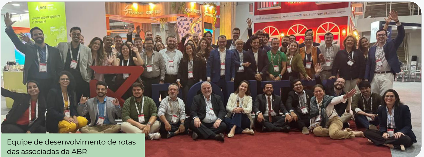
Equipe de desenvolvimento de rotas das associadas da ABR

A ABR participou do Routes Americas 2026 - realizado no Aeroporto do Galeão (RJ) - acompanhando de perto um dos principais fóruns globais de desenvolvimento de rotas aéreas.