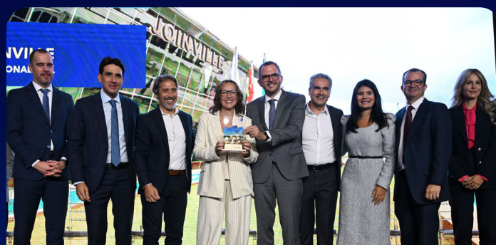
O Aeroporto de Joinville, administrado pela Motiva, foi destaque na região Sul