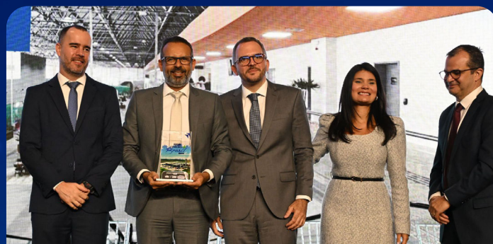
Aeroporto de Aracaju, administrado pela Aena Brasil, foi o melhor do Nordeste