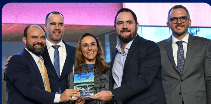
O Aeroporto de Sinop, administrado pela Centro-Oeste Airports, venceu no Centro-Oeste e Norte