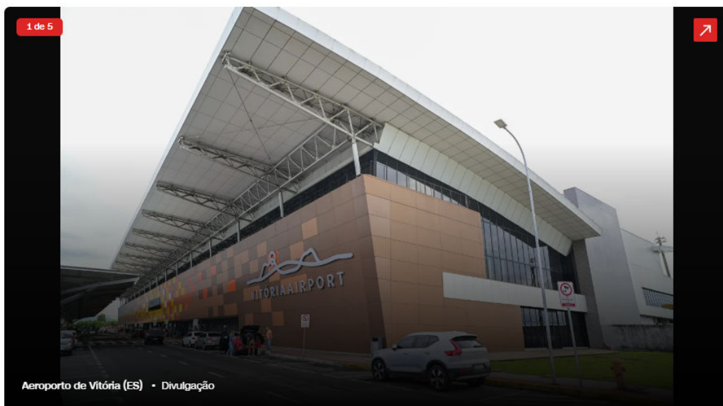
Aeroporto de Vitória (ES)