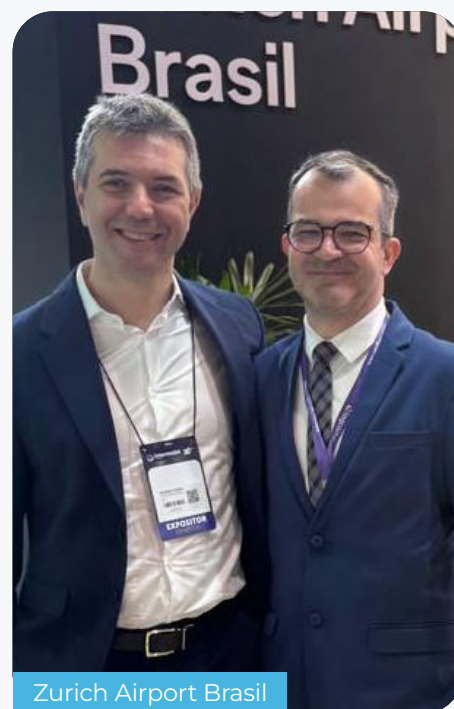
Zurich Airport Brasil